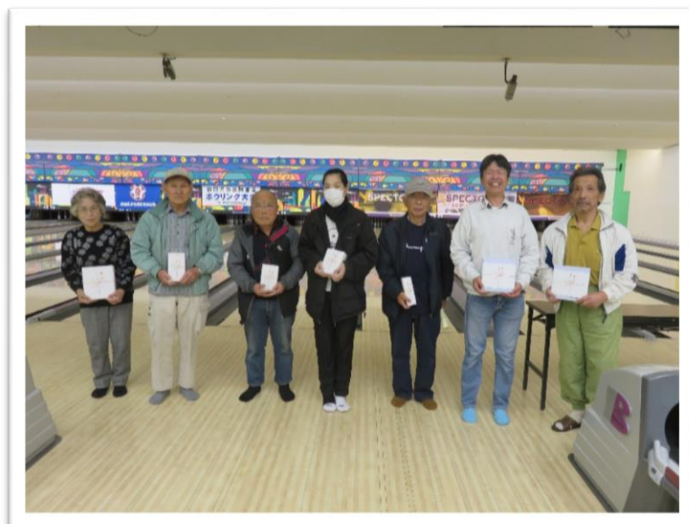
飛び賞、ブービー賞のみなさん