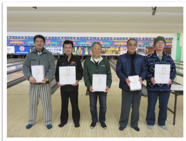
左から男子 1 位～5 位