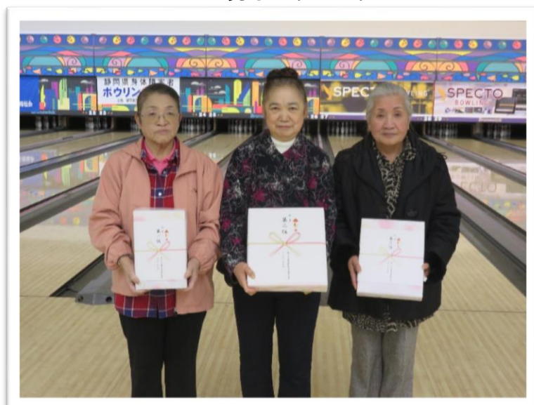
左から女子 1 位～3 位