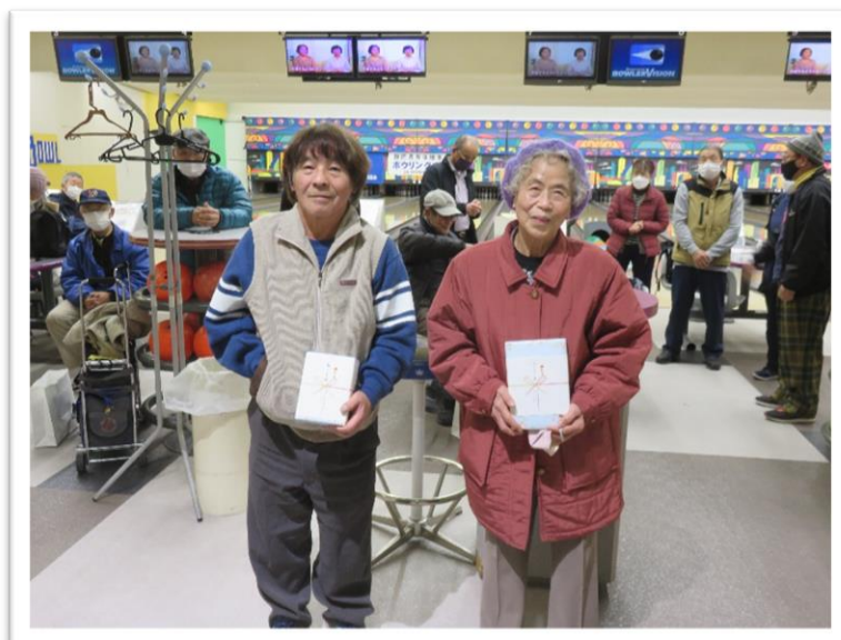
飛び賞、ブービー賞のみなさん