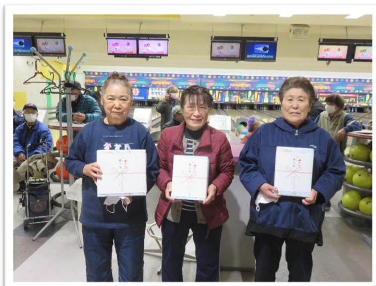
左から女子 1 位～3 位