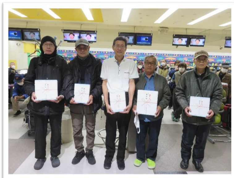
左から男子 1 位～5 位