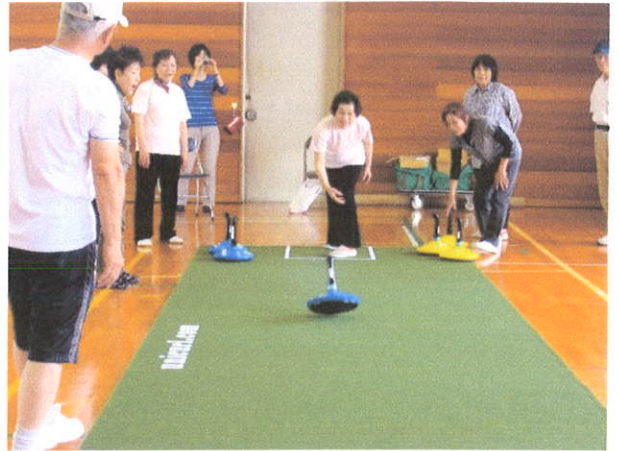
ユニカールにチャレンジする参加者

対戦型のスポーツであるシャフルボードやユニカールのコーナーでは、チーム内で作戦を練ったり、歓声を上げながら得点を競い合う楽しそうな参加者の姿が見られました。