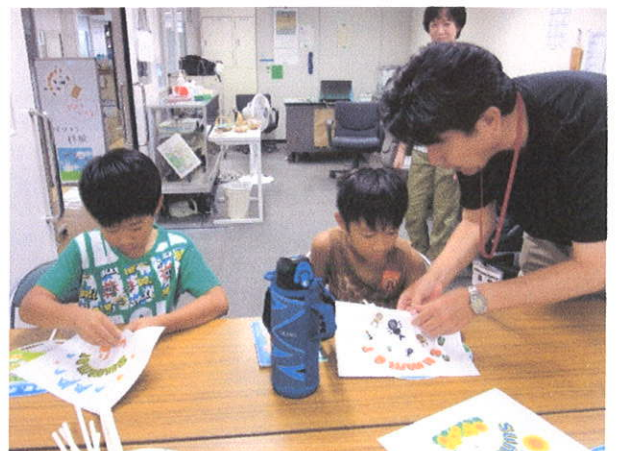
オリジナルうちわ作りに挑戦中!!

また、マルチメディア情報センターでは、視覚障害者用パソコンの紹介やオリジナルうちわ作りの体験も実施しました。文字の色や図柄を自分流にアレンジして制作できるとあって、子ども等を中心に多くの方が足を止め、体験に参加していただき、大好評でした。