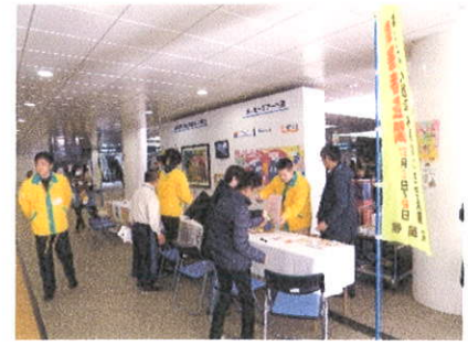
静岡県障害者芸術祭 昨年の様子