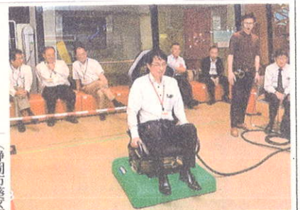
小型地震動シミュレーター「地震ザブトン」を体験する県危機管理部職員 =15日午後、静岡市葵区の県地震防災センター