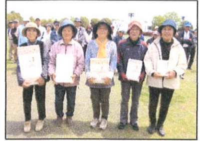
【男女1位~5位(右から1位)】

いつも遠くから交流大会に参加いただき心より感謝しております。お手伝いをいただきました会員の皆様ありがとうございました。結果は、下記の通りです。詳細は、ホームページをご覧ください。