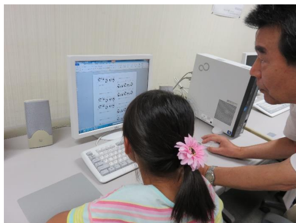
オリジナル名刺を作成する来場者

パソコン体験コーナーでは、昨年のオリジナルうちわ作りに続いて、今年は、自分の住所や名前、メッセージ等を自由に入力して完成させるオリジナル名刺を作成してもらいました。参加してくれた子どもたちの中には、キーボード操作に慣れた子たちも多く、短時間であっという間に仕上げていました。