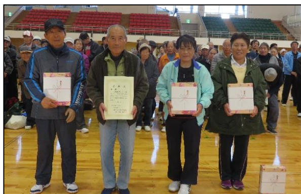
優勝 三島市Aチーム

フライングディスクは、今年で12回目を迎えました。年々皆さんの技術が上がっている事に驚かされます。フライングディスクは、リハビリにも効果的ということで熱心に取り組まれる方も多くいらっしゃいます。日頃、スポーツをすることのない方でも比較的簡単に取り組むことが出来るスポーツです。是非、まだやったことのない方は、チャレンジしてみてください。今年度も三島市Aチームが優勝しました。おめでとうございます。