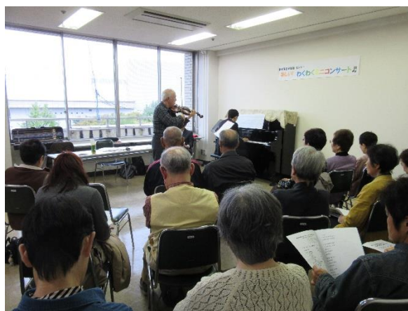
素晴らしい演奏に聴き入る参加者

参加者の皆さんの口コミのおかげもあって、当日は20名を超える大勢の参加者にお集まりいただき、大変活気のあるコンサートになりました。皆さんからいただいたアンケートには、「音楽を聴いて楽しい気分になり、声を出すことで自分が元気になり、大変良かった。」「どの曲も心癒されるよい曲ばかりでした。」など、好評の声がたくさん寄せられ、普段なかなか聴くことのできない生の演奏に、参加者も大変感動している様子でした。「来年も是非!」という声も多く聞かれ、次年度以降も、皆さんに元気を届けられるような楽しいコンサートを続けていければいいなと思いました。