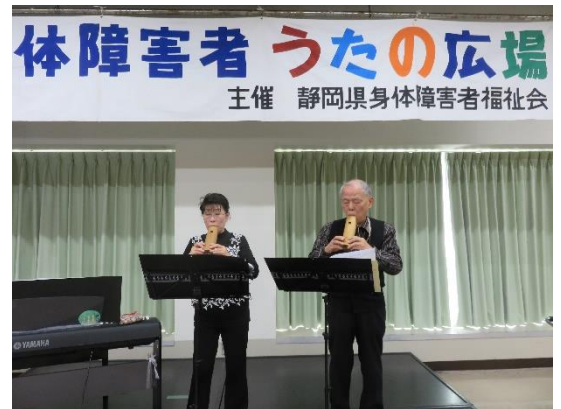
昼のアトラクション コカリナコンサート