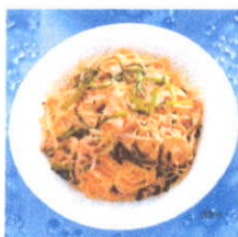
豚肉とニラでスタミナアップ!!