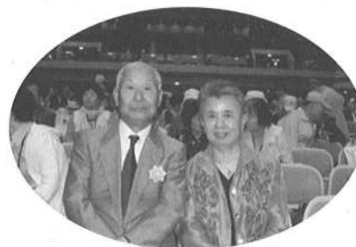
浜松市の倉橋夫妻