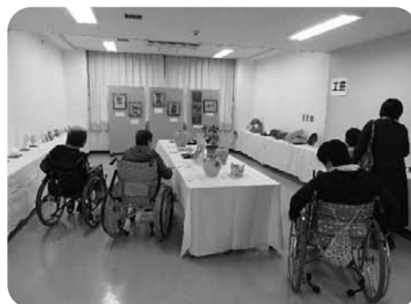
開催期間中の会場の様子

このたび、最優秀賞（静岡県健康福祉部長賞）に輝いた皆さんは以下のとおりです。おめでとうございます！