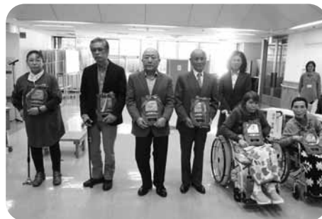
最優秀賞受賞のみなさん

優秀賞・特別賞・努力賞の入賞者は県身障福祉会ホームページ（ http://www.e-switch.jp/shizuo-ka-shinsyo/ ）に掲載しています。