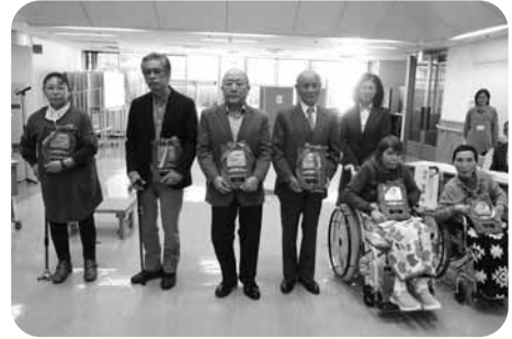
最優秀賞受賞のみなさん