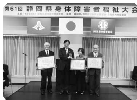
知事功労表彰・知事褒賞受賞者

第2部の研修では、2018年3月に静岡県が手話言語条例を施行したことを受けて、手話の歴史や県内の手話言語条例の施行状況などについて、ビデオ視聴や解説により理解を深めました。