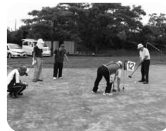
和気あいあいと交流を楽しみました

今年の6月23日(日)には、初めてグラウンド・ゴルフ交流会を実施しました。より多くの会員に参加してもらうため、この交流会では順位をつけず、参加者全員に賞品がつけました。