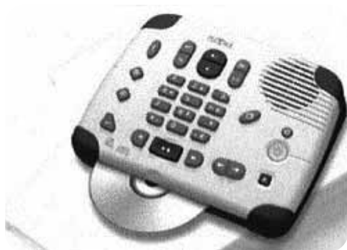
フレクストーク CD 1枚に約30時間の記録が可能

【お問い合わせ】静岡県点字図書館 電話：054-253-0228 E-mail：shizuten@shizuten.jp