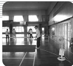
扇風機で熱中症対策!!

皆様からたくさんのご協力をいただき、このたび、障害者福祉センターが管理・貸出を行っております県総合社会福祉会館6階の体育館に扇風機2台を購入、設置することができました。これから来る暑い夏に向けて強い味方になってくれそうです。どうもありがとうございました。