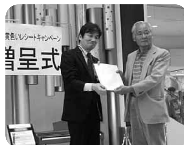
商品カードを受け取る二橋会長（写真右）

本年は、トイレットペーパー・ファイル・コピー用紙・FAXインクフィルム・パソコンインクリボン等の商品に交換しました。コピー用紙は、当会の機関誌「つえ」の印刷用に、インクリボンやフィルムはパソコン担当者や支部長に配布し、経費の削減につなげています。