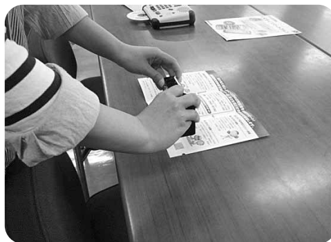
スピーチオ SPコードにかざすだけでデータを読み上げます