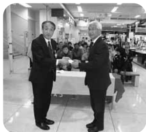
贈呈式 4月11日イオン清水店にて

私たち静岡県身体障害者福祉会では、昨年1年間、静岡市内にありますイオン清水店・マックスバリュ静岡丸子店の2店舗にご支援をいただき、幸せの黄色いレシートキャンペーンに参加してまいりました。