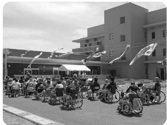
気持ちの良い晴天に恵まれました

三幸にご支援、ご賛同いただいているの方々に感謝すると共に今後もよりよい施設づくりに努めてまいります。