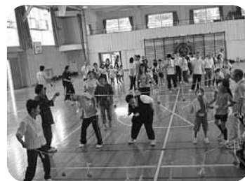
ふれあい運動会に参加しました

障害者虐待防止法・障害者優先調達推進法・障害者総合支援法・更には障害者差別解消法の成立と、今、我々障害者を取り巻く環境はめまぐるしく変化しています。そのような状況の下で、私たち障害者が取り残されないためにも情報の格差を埋めるための支援講座の開催等、積極的に取り組んでいこうと考えています。