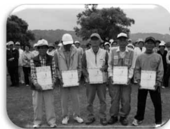
【左から 1 位から 5 位】

今回の大会は、会場の関係で東部ブロックの参加者が大幅に減ってしまいましたが、なんとか無事に大会を終了することが出来ました。お手伝いいただきました役員の方々にこの場をお借りしてお礼申し上げます。