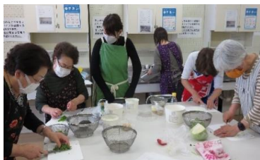
先生に教えてもらいながら調理していきます！

この日はタコライス、野菜たっぷりごまサラダ、ふわふわ卵スープ、アフォガードを作りました。先生の説明を聞いて、皆さん手際よく調理していきます。完成した料理はどれもとても美味しそうでしたよ。「タコライスはあまり家では作らないからとても勉強になった」という声も聞かれました！（定員がいっぱいのため、今年度の募集は締切らせていただいております。ご了承ください。）