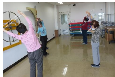
ひもを使い、左右に体を伸ばします。