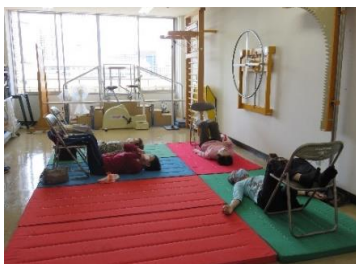
ゆっくり深呼吸しながらストレッチをしています。

トリム体操とは、元気で健やかに生きていくための体づくりを目的とした体操です。だれでも、どこでも、いつでも楽しく無理なくできる運動を取り入れていますよ。音楽を聴きながらリラックスした状態でストレッチをしたり、体をほぐしていきます。体に負担なく出来るものばかりですし、家でもやってみようと思えるものがたくさんありました！