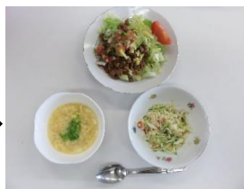
タコライス、スープ、サラダの完成～！