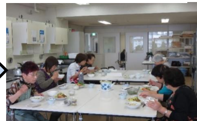
皆さんでランチタイム！お味は...？