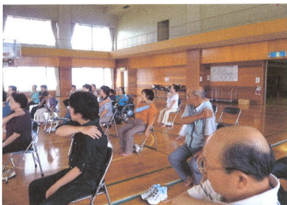
ハッスル！ ハッスル 気持ちのよい汗をかいたよ。