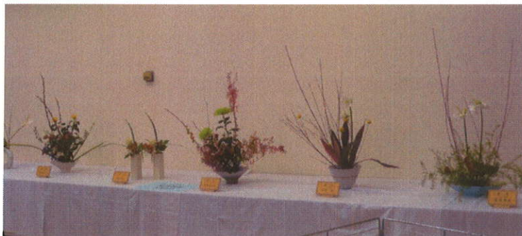
生花教室の皆さんが、作品展に 花を添えてくださいました。