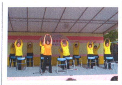
音楽に合わせてトリム体操!!

10月25日(土)静岡市の中心市街地にある”葵スクエア”を会場に、「静岡県障害者芸術祭 ～夢いっぱいアートフェスティバル2014～」が開催され、私たち県身体障害者福祉センター訓練教室の『トリム体操教室』のみなさんと、福祉センターの体育館を利用してくださっているグループ『Angel』のみなさんが、みんなで交流ステージの舞台に登場して日頃の練習の成果を発表してくれました。