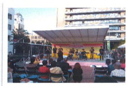
Angelさんのダイナミックな合奏♪