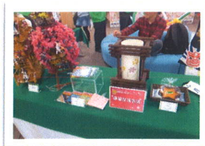
授産製品コンクールの作品