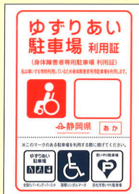
車いす常時利用者用