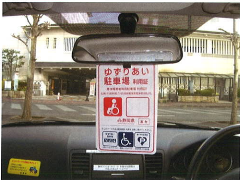
(利用証掲示のイメージ)