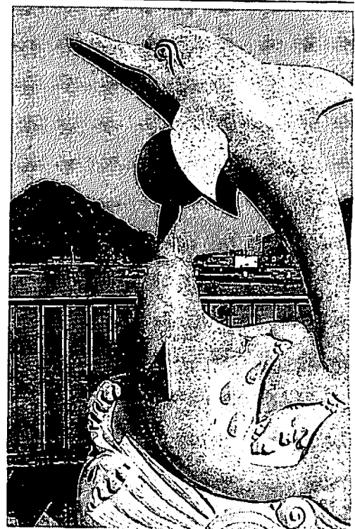
イルカ石像 記念の地