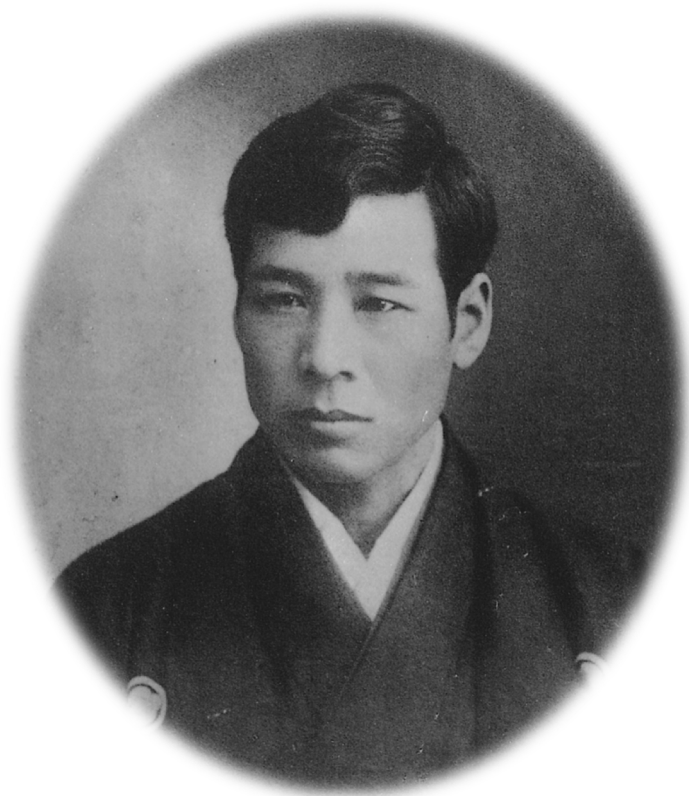
若かりし頃の豊田佐吉(湖西出身)