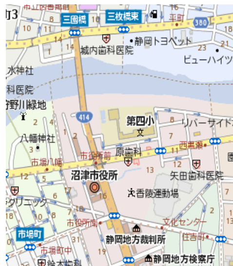
ゲートボール会場