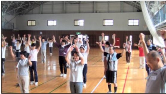
↑ セ～のっハイっ！準備体操♪