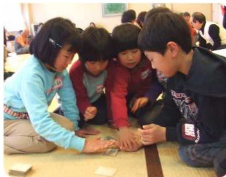
子供の部 みんなの 反応が早い!

御前崎市で伝統のある手話カルタ大会が開催されました。子どもから高齢者と誰でも楽しんだ大会の様子をどうぞ。