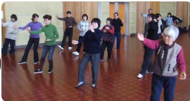
ゆった〜り〜と・・・