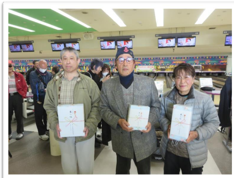
ノングターレーンクラス(左から)1位~3位