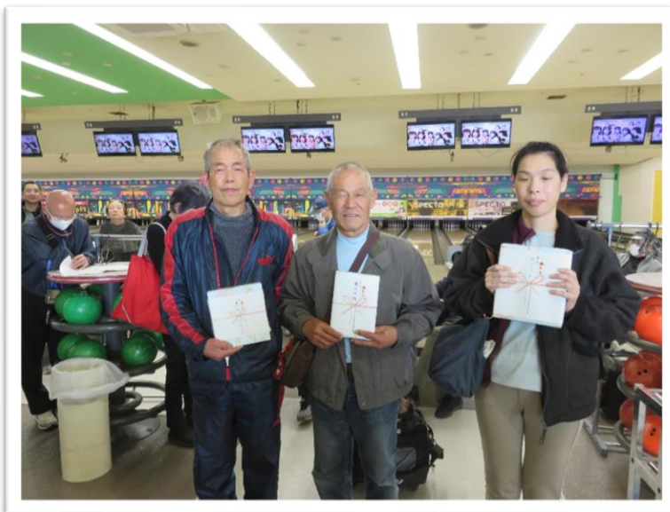
通常レーンクラス 飛び賞・ブービー賞のみなさん