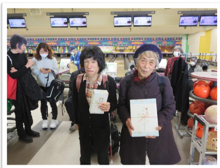
ハンガターレーンクラス 飛び賞・ブービー賞のみなさん