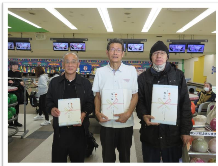
通常レーンクラス(左から)男子1位~3位