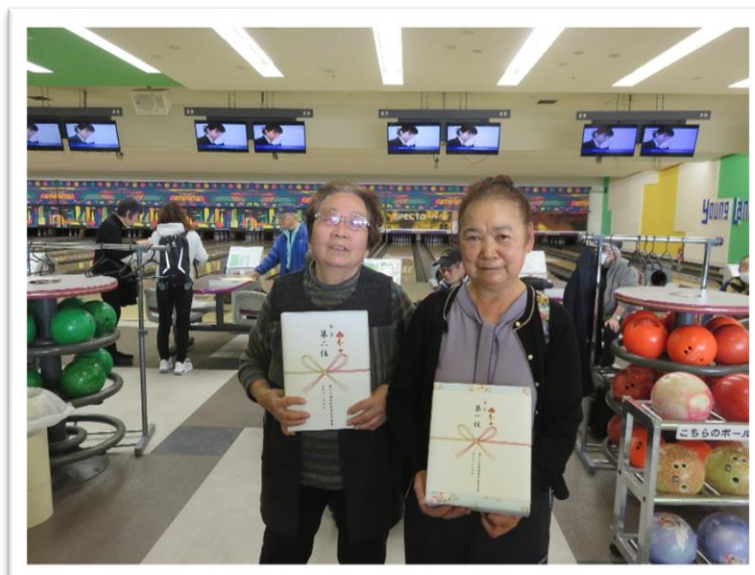
通常レーンクラス(右から)女子1位・2位